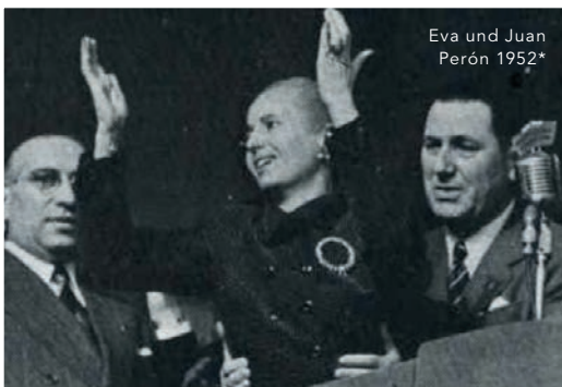
Eva und Juan Perón 1952*